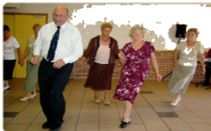
Danse de groupe