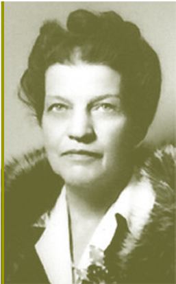
Cairine Reay Wilson